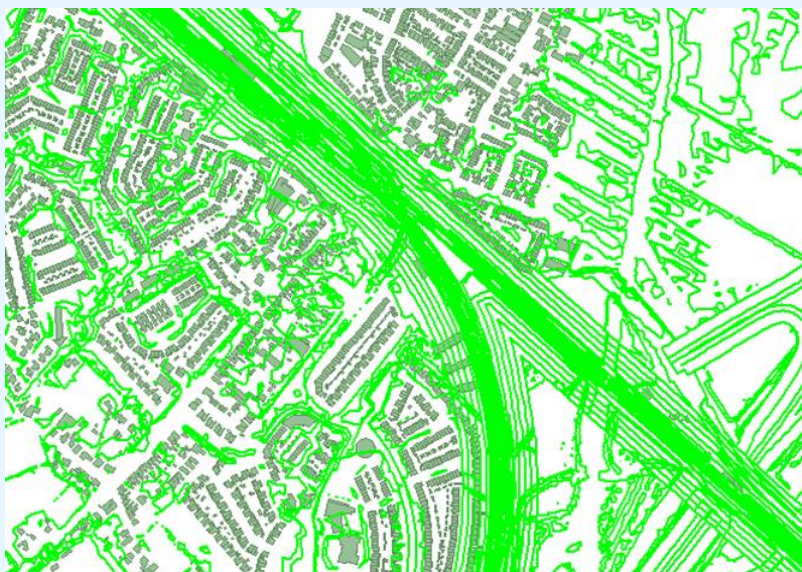
Figuur voorbeeld hoogtelijnen (lichtgroene lijnen)

Voor de hoogteligging van en rond de rijkswegen en hoofdspoorwegen is uitgegaan van de hoogtelijnen uit de dataset van Rijkswaterstaat en ProRail. Deze dataset is door InfoMil aangeleverd ten behoeve van de EU-geluidkartering.