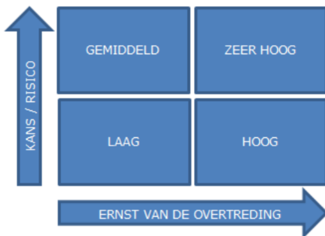
Figuur 2. Achtergrond risicomatrix.

De prioritering wordt onder andere gebaseerd op een inschatting van het risico op de negatieve effecten bij het overtreden van de wettelijke bepalingen. Dit kan worden bepaald per branche en/of voor bepaalde milieuaspecten. De risicoanalyse brengt het risico in beeld dat aan elk van de branches of aspecten is verbonden. Het risico is daarbij gedefinieerd als het negatief effect van niet-naleving maal de kans op niet-naleving. Ofwel: \text{risico} = \text{effect} \times \text{kans} . In figuur 2 is dit verband grafisch weergegeven.